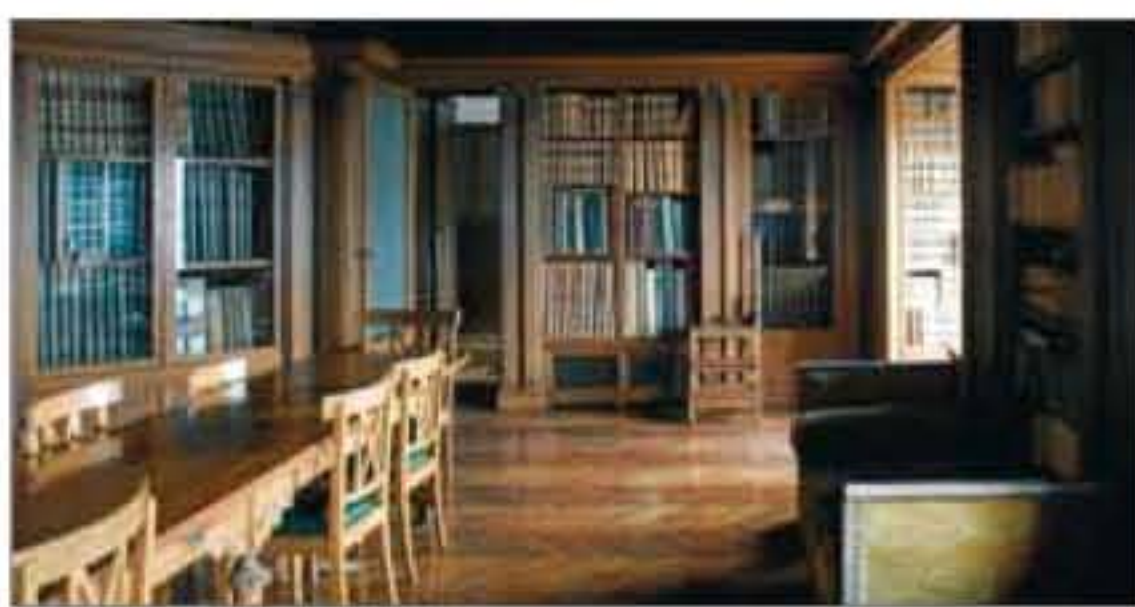
L'Institut Cambó té la seva seu a la Via Laietana i conserva l'atmosfera de principis del segle XX